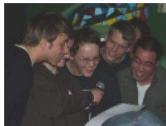
Clueso rappt mit Studenten

Zwei Rapper aus Erfurt, auf Tour durch Nordamerika mit der großartigen Unterstützung des Goethe-Instituts, rappten und didaktisierten mit Stil und Begeisterung im UW Grad House vor und mit fast sechzig Studierenden und Deutschlehrenden der Region. Nach wenig Zeit verwandelte das hochenergetische Paar den Raum in ein Rap-Studio für