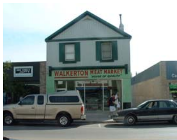
Walkerton Meat Market, 2005