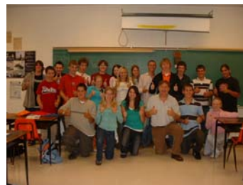
Grade 12 history class, 2005, Sacred Heart High School, Walkerton, Ontario

ested to see what further connections between Bruce County and Waterloo Region surface in the course of this work. Progress of the entire project can be monitored on